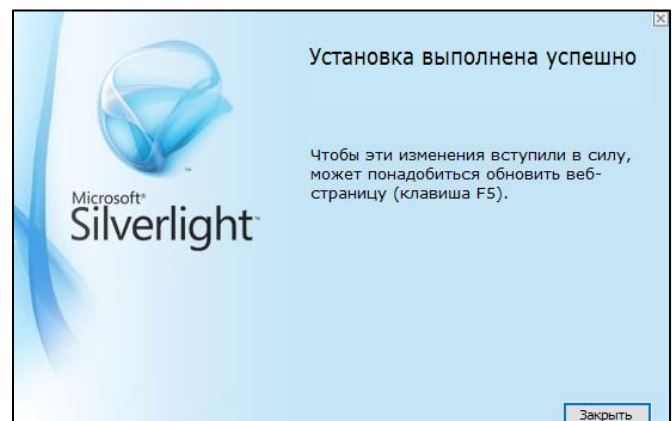
Рис. 4. Установка Silverlight завершена