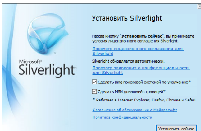
Рис. 3. Запуск установки Silverlight

По окончании загрузки отобразится окно установки Silverlight (рис. 3). Галки «Сделать Bing поисковой системой по умолчанию*» и «Сделать MSN домашней страницей*» можно снять. Для начала установки нажмите кнопку «Установить сейчас». Процесс установки занимает 2-3 минуты. По его окончании отобразится надпись «Установка выполнена успешно». Модуль установлен – можно продолжать работу с информационной системой. Если вы отключали VPN для загрузки файла, то VPN следует подключить повторно.