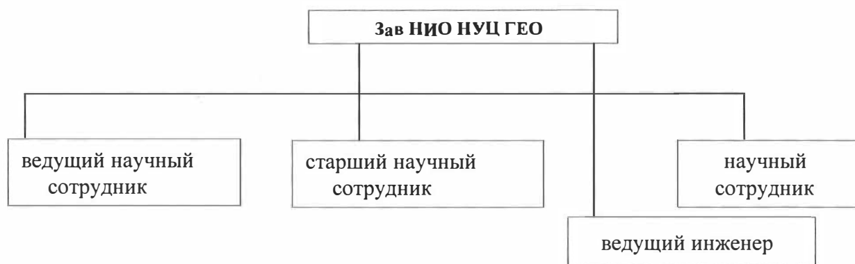
Рис. 1. Структура НУЦ ГЕО

Структура и штат НИО НУЦ ГЕО представлены на рис. 1