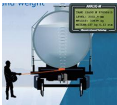
Рис.1 Схема измерения уровня нефтепродуктов в ж/д цистерне.

Во многих отраслях используются закрытые резервуары или цистерны для хранения и транспортировки жидкостей. Измерение объема жидкостей в них осуществляется с помощью стационарных ультразвуковых (УЗ) уровнемеров, первичные датчики которых располагаются внутри резервуаров. Однако ГОСТ 12.2.003-91 на условия хранения и перевозки токсичных, химически активных и пожароопасных жидкостей требует, чтобы датчики измерителей уровня располагались снаружи резервуара (как правило, со стороны дна цистерны). Но таким уровнемерам присущ недостаток, заключающийся в наличии большой "мертвой зоны": они обеспечивают измерение уровня жидкости, начиная с H_{мз} \approx 150-200 мм, и не позволяют точно определить, например, уровень нефти, оставшейся после ее слива из цистерны. Учитывая стоимость нефти и объем цистерны, очевидна необходимость строгого учета даже минимального количества остатков (см. рис.1).