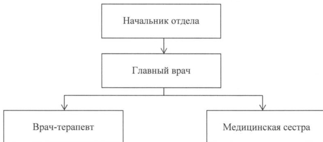
Рис. 1 Организационная структура отдела медицинской помощи.

2.1 Организационная структура отдела представлена на рис.1